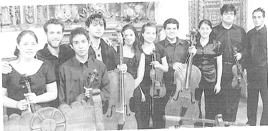
Le Paraguay Barroco : un ensemble de virtuoses qui mêle les instruments européens et autochtones.

Pour fêter la 10 e saison de son Espace culturel, la commune d'Avoine convie son public à un anniversaire tout en bougies, en cadeaux, en gâteau et en cerises sur le gâteau, évidemment. Pour ouvrir les festivités, une formule de trois spectacles pour 15 € est proposée au public pour découvrir trois pro-